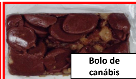
Bolo de canábis