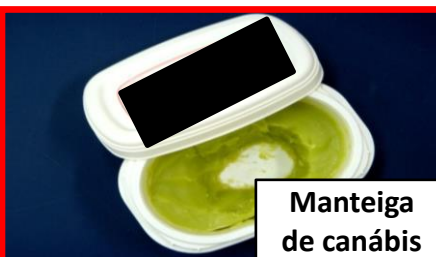
Manteiga de canábis