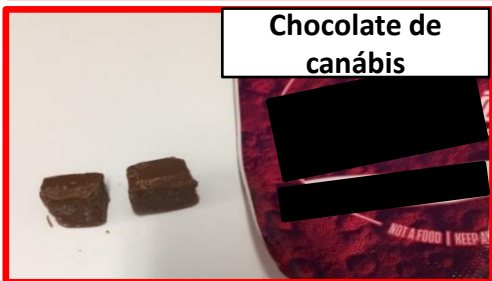
Chocolate de canábis