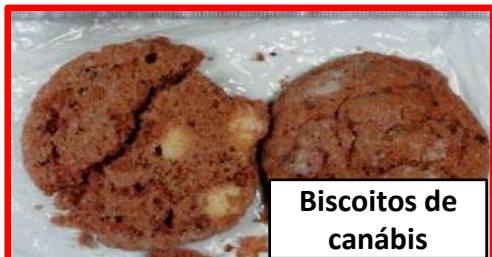
Biscoitos de canábis

✂ Produtos feitos com canábis: aplica-se a todos os produtos em que são utilizadas outras partes do cânhamo para além das sementes ou caules maduros (à exceção de resina).